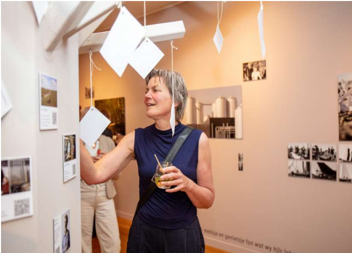
Fotograaf Gitta Brugman exposeerde haar werk tijdens de Siel fan Sudwest in het FSM.