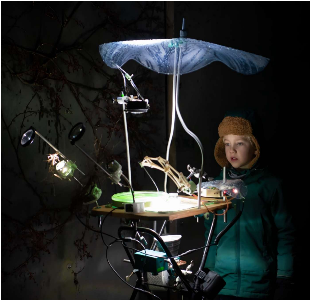
Een jong bezoekertje kijkt verwonderd naar de installatie van Raumzeitpiraten in de museumtuin tijdens Walfisk.

Nog zo'n voorbeeld was de samenwerking met het Comité Sneek 80 jaar vrij. Onze uitverkochte voorstellingen van Door het donker en drukbezochte stadswandelingen en lezingen waren onderdeel van het totaalprogramma. Het museum verzorgde ook de kaartverkoop voor de andere evenementen. In het najaar vierde Sneek 500 jaar vrije koopstad, ook daar was het museum nauw bij betrokken. Zo zorgen we, samen met de vrijwilligers van alle partijen, voor een bruisend culturaanbod in de stad, en voor een bredere zichtbaarheid van ons museum. Bij de opening van het watersportseizoen en de Open Monumentendag stellen we ons museum ook graag gratis open om nieuw publiek te bereiken. Kortingsacties, zoals het afgelopen jaar met de Postcodeloterij en met Poiesz Supermarkten, helpen daar ook bij. En natuurlijk doen we met advertenties en pr ons uiterste best om al het moois dat het museum te bieden heeft onder de aandacht te brengen.